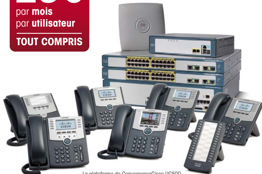
La plateforme de ConvergenceCisco UC500 et les postes IP associés